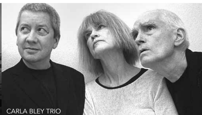
CARLA BLEY TRIO