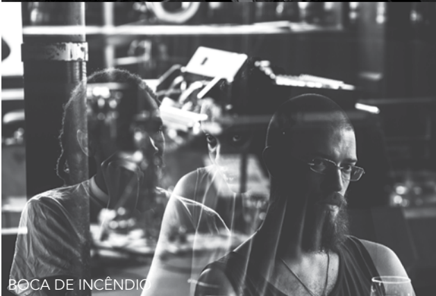
BOCA DE INCÊNDIO