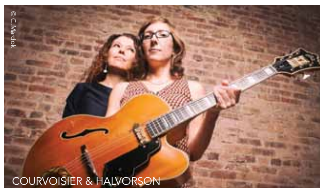
COURVOISIER & HALVORSON

Disponíveis na Bilheteira online [BOL.pt], lojas parceiras e, no próprio dia, na bilheteira do Salão Brazil